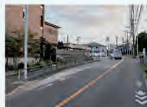
諏訪神社前バス停