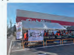
北部のびのびマルシェの様子

当地区は若年層が調布市内でも比較的多く暮らしており、子育て環境に関して農地・緑地分野においては、 子供達が安心して過ごせる 、また保護者の方たちが安心して遊びに行かせられ、土地や動植物に触れられ、 豊かな体験が得られる公園や緑地づくり を目指します。