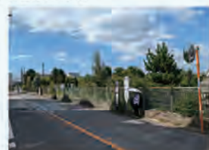
上ノ原小学校バス停

当地区の生活道路は狭く、一方通行や行き止まりがあるなど、事故勃発の恐れや災害時のスムーズな避難・救助が困難である等の危険が懸念されています。 安全、快適に地区内を移動可能な生活道路の整備 を目指します。